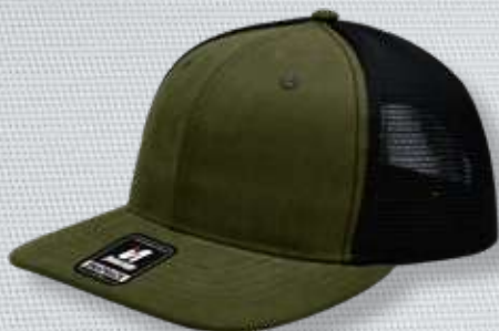
DK GREEN BLACK