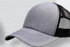
HEATHER GREY/ BLACK