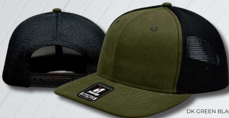
DK GREEN BLACK